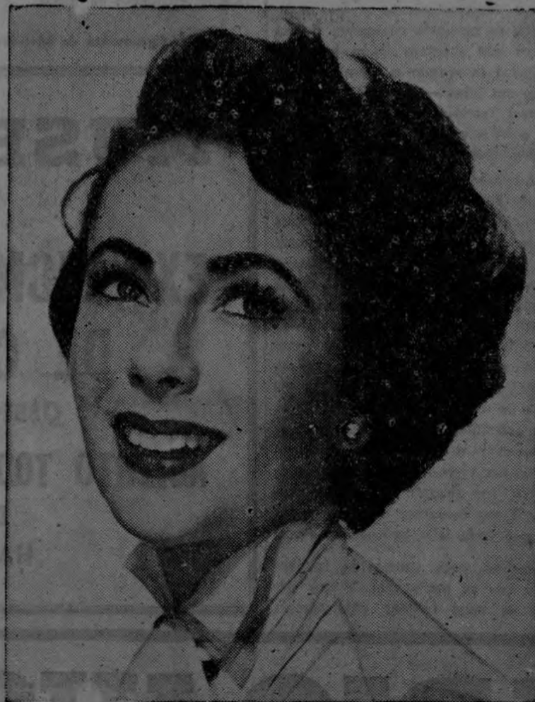
ELIZABETH TAYLOR, ESTRELLA DE LA METRO-GOLDWYN-MAYER

Elizabeth Taylor fué dotada por la naturaleza de una hermosura casi increíble... y de un cuerpo que llena todos los requisitos de la perfección.