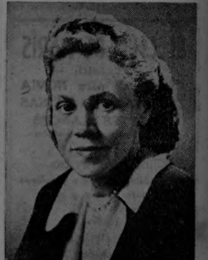
Sra. Eugenie Anderson